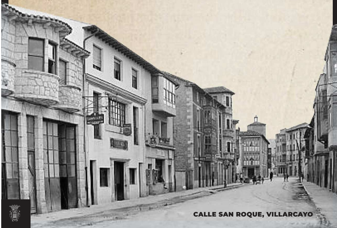
CALLE SAN ROQUE, VILLARCAYO

“Villarcayo, un lugar perfecto para los amantes del arte, la historia y el deporte”